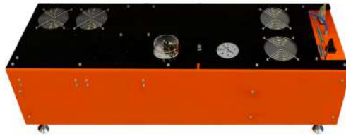
Электропневматический усилитель давления K-450