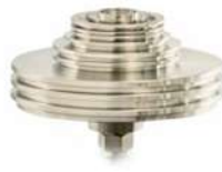
Измерительные поршневые системы МП и МГП с наборами грузов

Измерительные поршневые системы МП и МГП с наборами грузов.