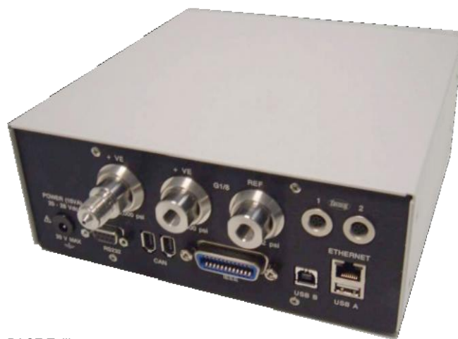
PACE Tallis – вид сзади

Калибратор Tallis будет снабжен применимой маркировкой соответствия стандартам. При необходимости также может быть нанесена дополнительная региональная маркировка.